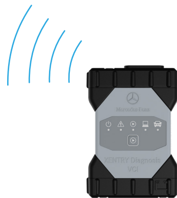
XENTRY Diagnosis VCI

Durch eine zweite integrierte WLAN-Karte wird eine stabilere Verbindung zwischen dem XENTRY Diagnosis Pad 2 und dem XENTRY Diagnosis VCI erreicht.