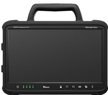
XENTRY Diagnosis Pad 2